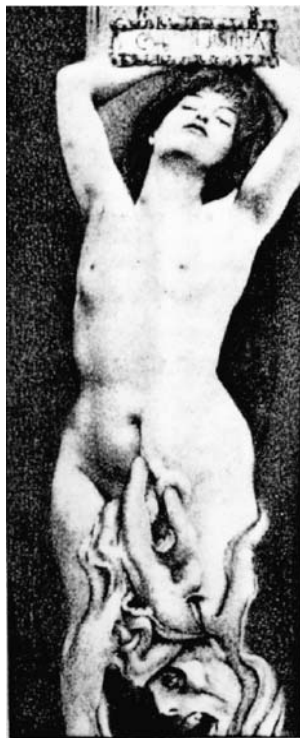
Fig. 2 –KHNOPFF, Fernand Istar, 1888 Sanguínia s. papel 16,5 x 7 Col. Particular